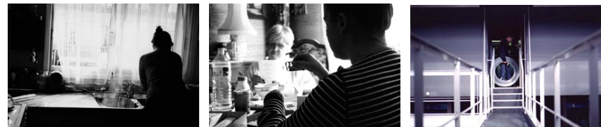
Extraits du travail de la photographe Céline Dos Barros intitulé « La solitude au travail »

Buena Vista Games, BASF, Mattel, Eugène Perma, VINCI, SITA France, Gaz de France, Sagem, Matussière et Forest.