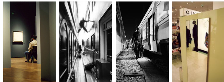
Extraits du travail de la photographe Céline Dos Barros intitulé « La solitude au travail »

Emploi, compétences, économie, culture, événements, OP3 communication s'intéresse notamment à la professionnalisation de la communication des PME et des collectivités.